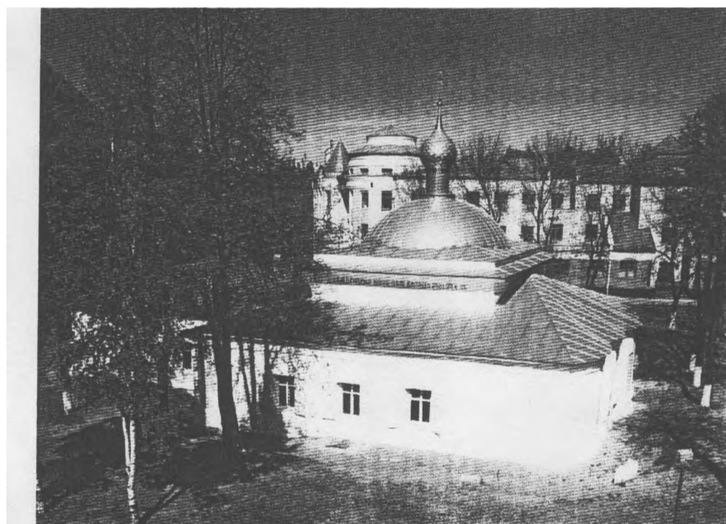
Храм Параскевы Пятницы 1

На высоком берегу Волги в зелени парков и бульваров раскинулся город Ярославль. Немного городов России могут сравниться с нашим городом по своему возрасту, богатству истории по красоте и уникальности архитектурных памятников. Особенностью нашего города является гармоничное сочетание старины и современности, что придает Ярославлю неповторимый облик и особое очарование. Смешанность различных архитектурных направлений и стилей, которые представлены в Ярославле, позволяет многим искусствоведам называть его «Флоренцией русского Севера». Ярославль - старинный русский город, обладающий памятниками древнего зодчества, что даже для простого их перечисления понадобилось бы много времени. Ярославль - город давних и крепких религиозных традиций, город живой веры. Уже полтора столетия назад ярославские церковные реликвии, древности и обычаи стали предметом изучения и описания в исторических очерках, обзорах, монографиях и книгах.