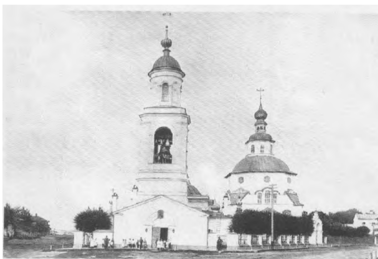
Храмы св. вмц. Параскевы Пятницы и Живоначальной Святой Троицы в Калачной слободе. Начало XX века

Каждый год 10 ноября православные ее именины. День этот многие годы был престольным праздником и в Калачной слободе в Ярославле, где и сейчас стоит храм в честь святой великомученицы Параскевы